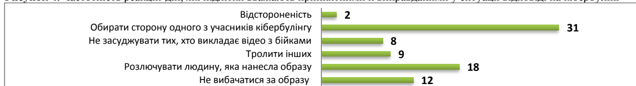
Рисунок 4. Частотність реакцій-дій, які підлітки вважають прийнятними й виправданими у ситуації відповіді на кібербулінг

Занепокоєння викликають зауваження підлітків щодо можливості легко й безпечно демонструвати в умовах інтернет-спілкування негативні емоції: злість, роздратування, озлобленість, тому й у реальному житті перед вчителями й батьками вони виглядають не зухвалими бешкетниками, розбишаками, а тихими, мовчазними, відстороненими особистостями. Тобто девіантна поведінка підлітків є замаскованою, і вони дуже добре розуміють цей момент. Так, з певним задоволенням і гордістю підлітки розповідали про те, як вони «тролили», «пранкали», «банили» когось, перебуваючи на уроці, поряд із батьками, а дорослі, навіть, не здогадувалися про це, оскільки вони (підлітки) «мило посміхалися», «не заважали вчительці проводити урок», «тихенько сиділи за монітором», «вдавали, що сплять чи відпочивають».