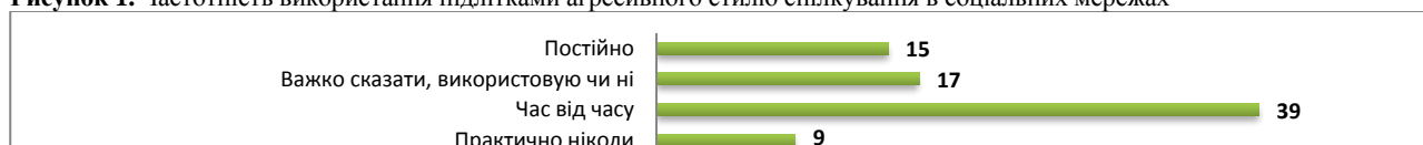
Рисунок 1. Частотність використання підлітками агресивного стилю спілкування в соціальних мережах

Результати й обговорення. Порядкова шкала оцінок дала змогу зафіксувати згоду чи незгоду із судженнями, які тією чи іншою мірою характеризують предмет опитування (Див. рис. 1). Підліткам було запропоновано обрати варіант відповіді на питання – «Як часто ви використовуєте агресивний стиль спілкування в соціальних мережах»: А. Практично ніколи; Б. Час від часу; В. Важко сказати, використовую чи ні; Г. Постійно.