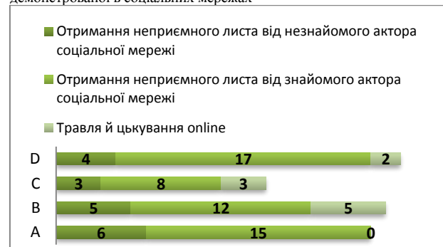
Рисунок 3. Кібербулінг і реакції-протидії щодо девіантної поведінки, демонстрованої в соціальних мережах

Найактивніше підлітки виявляють девіантну, агресивну поведінку при схвальному ставленні до неї з боку інших акторів соціальних мереж: пор. у 44 випадках (55 %) підлітки як реакцію на кібербулінг обирають «розташування вигаданої інформації про знайомого / незнайомого актора в групі чи на сторінці власника акаунта, щоби інші посміялися над ним» (26,3 %) і «обговорювання інформації про людину з іншими без її відома» (28,8 %).