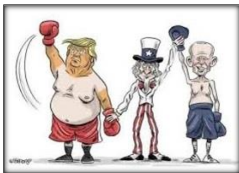
Рис. 8. [15]

На вербальному рівні стаття розкриває тему карикатури « In addition to recovering from COVID, I hope Joe Biden's America will recover our democracy with truth and justice for all », тобто, під « recover our democracy » карикатура зображає процес зашивання прапору. Але в статті немає жодного слова про Дональда Трампа. Отже карикатура лише частково корелює зі статтею, тобто виконує демонстративну функцію щодо самого вербального тексту статті. У самому тексті статті немає згадки на карикатуру, а отже текст може існувати без неї.