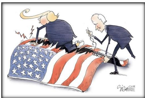
Рис. 7. [14]

США Джо Байденом. У самій статті є згадка про карикатуру: « This means that unfortunately for Obama, he's going to have to remove the tape from Joe's mouth, like in this cartoon by Taylor Jones... ». Тому ця карикатура виконує дейктичну функцію, оскільки пов'язана з текстом.