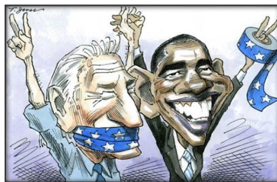
Рис. 6. [13]

У тексті статті поверхнево описано карикатуру, яка дає змогу зрозуміти, що карикатура присвячена виборам 2016 року. У ній не пояснюють жоден із проілюстрованих епізодів. Тому карикатура виконує лише демонстративну функцію у тексті. Бачимо покликання в тексті. Однак текст без карикатури може існувати.