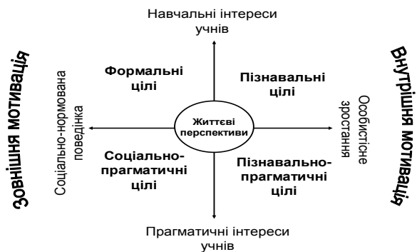
Рис. 1. Типологічна модель навчального цілепокладання у ранньому юнацькому віці

Зважаючи на вищезазначене, базовими критеріями для визначення цілей навчання у ранньому юнацькому віці є: навчальний чи прагматичний інтерес учнів, їх стратегічні настанови на особистісне зростання або на соціально-нормовану поведінку. Комбінування між собою вказаних критеріїв зумовлює появу різновидів навчальних цілей і визначає типологічну модель навчального цілепокладання у старшокласників: пізнавальний тип, пізнавально-прагматичний тип, соціально-прагматичний тип, формальний тип. Схематично типологічна модель досліджуваного феномену представлена на рис. 1.