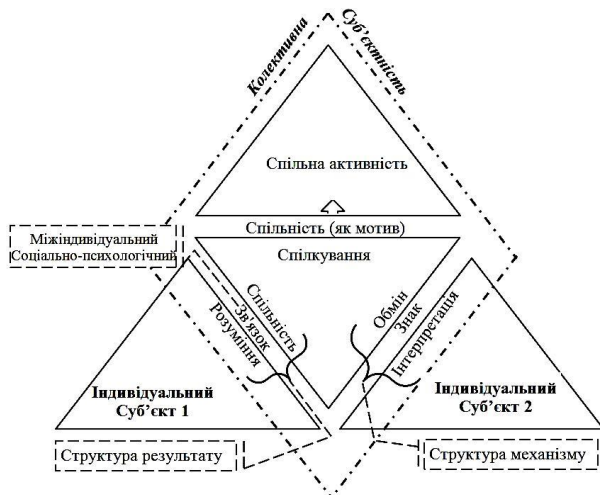
Схема 2. Структура мотиваційного виміру спільності відносно комунікаційного механізму спілкування.

Звідси бачимо – конкретизація мотиваційного виміру спільності припускає поуточнення змістовного наповнення підструктур результату та механізму. У якості конкретизації внутрішньо-суб'єктного процесу вже було указано такі процеси як ідентифікація та інтерпретація [2, с.56]. Окремою складовою конкретизації є конструкт чинника (посередника) зв'язування. Зокрема, на відміну від знака як елементу зв'язування, що є складовою комунікації та реалізує свій вплив через процес обміну (див. схему 2), у межах, до прикладу, культурно механізму спілкування чинником виступає річ, ідея або інтер-суб'єктивний простір як спільно утворені об'єкти/предмети [2, с.55] (див. схему 3). За такої умови конкретизація зовнішньо-суб'єктного процесу набуває значення процесу практикування. Відповідно, відносно культурного механізму практикування виступає ustalеним процесом, в той час як конструкт чинника припускає подальшу конкретизацію.