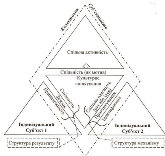
Схема 3. Структура мотиваційного виміру спільності відносно культурного механізму спілкування.

Відносно прескриптивного механізму [2, с.54] у якості чинника доцільно виокремлювати характеристику (ознаку, властивість, стан) людини. Тоді у якості зовнішньо-суб'єктного процесу постає екстраполяція (атрибуція) умови відносно якої людина може повстати у якості елемента спільноти як певної системи.