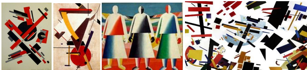
Рис. 1. Творчі роботи художників творчого напрямку супрематизм

Супрематизм Малевича визначається геометричними орнаментами і колірними рішеннями на білому тлі. Малевич створював нові конструкції об'єктів, які повністю відкидали зовнішні форми минулого, створюючи нову формальну динаміку енергії, відображаючи одночасно реалізм форм та їх абстрактний зміст [7].