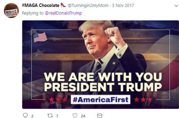
Рис. 7. Біомодальний прикріпний твіт-текст.

Біомодальні прикріпні твіт-тексти представлені, зокрема, респонсивним твітом користувача #MAGA Chocolate на ініціальному твіті Д. Трампа May God be w/ the people of Sutherland Springs, Texas. The FBI & law enforcement are on the scene. I am monitoring the situation from Japan [13] (рис. 7):