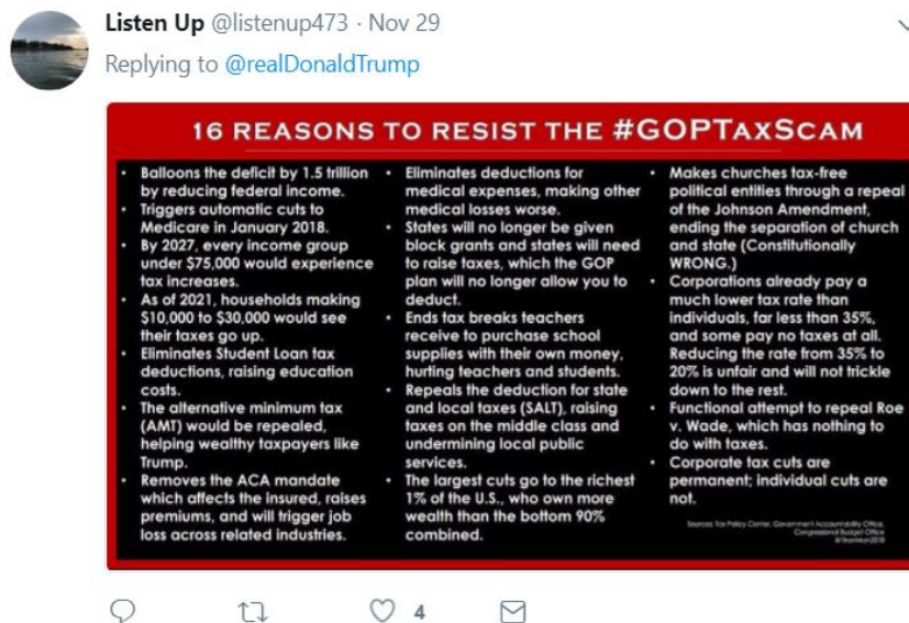
Рис. 4. Мономодальний прикріпний вербальний твіт-текст.

Прикріпне повідомлення також може бути представленим одним чи більше модусами, тобто бути мономодальним або біомодальним.