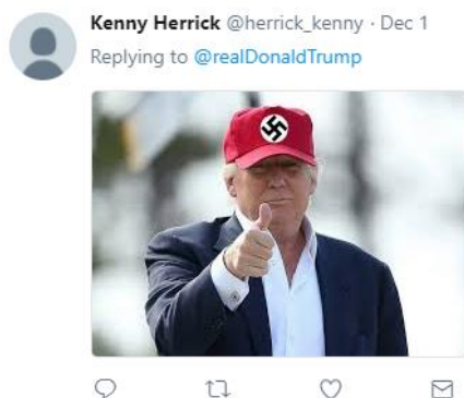
Рис. 6. Мономодальний прикріпний зображальний твіт-текст.

Мономодальні прикріпні зображальні твіт-тексти об'єктивуються статичним або динамічним зображенням. Прикладом першого є відповідь користувача Kenny Herrick на твіт Д. Трампа Great day for Tax Cuts and the Republican Party. But the biggest Winner will be our great Country! [8] (рис. 6):