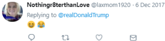
Рис. 5. Мономодальний набірний зображальний твіт-текст.

Мономодальні набірні зображальні твіт-тексти охоплюють набірні повідомлення, які містять тільки особливі символи, які у інтернет-комунікації мають назву «емодзі» та визначаються як «невеликі цифрові зображення або піктограми, що використовуються для вираження ідей чи емоцій» [7]. Прикладом даного типу твіт-текстів слугує відповідь на повідомлення Д. Трампа Funny to hear the Democrats talking about the National Debt when President Obama doubled it in only 8 years! [10] (рис. 5):