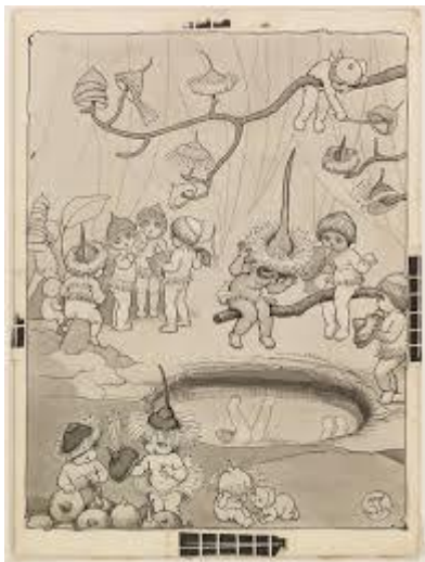
Рис. 5. Буш-магазин капелюхів

малюнку їх не можна знайти, адже вони знаходяться у іншій частині магазину ( You can't see them in the picture – they are in another part of the shop ). У наведеному контексті реалізується візуальний наративний прийом «розширення простору», що по-перше, деталізує та унаочнює явища, про які заявлено у текстовому фрагменті (shop), а по-друге, відкриває простір для уяви читача. Наратор наче створює лише половину картинки, а другу його частину пропонує відтворити у своїй уяві читачеві.