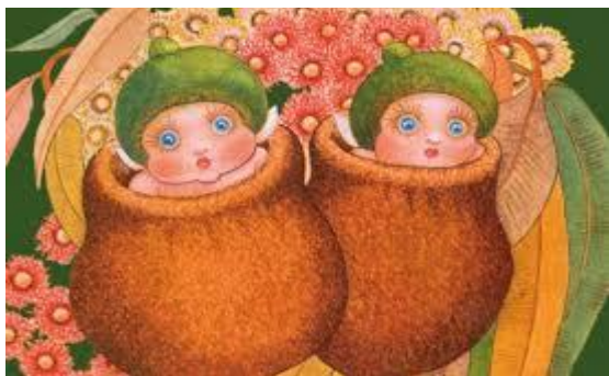
Рис. 2. Етноперсонажі казкового нарративу “Snugglepot and Cuddlepie”

нарації. Візуальні зображення несуть певне інформативне навантаження і разом із вербальною нарацією створюють єдиний нарративний простір казкового етнонарративу. У наведеному прикладі на ілюстрації зображено пухких малят-суцвіть евкалипту. Авторка втілює свій задум щодо зовнішності етноперсонажів через візуальний спосіб маніфестації і у такий спосіб створює єдиний образ, що існує у її творчій уяві і в уяві читачів казки, які точно знають як виглядають Снаглпот та Кадлпай.