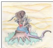
Рис.1. Драматичне минуле

що: «Процесуальна діагностика та корекція враховують динамічні характеристики психіки, внаслідок чого психолог має змогу визначати динаміку діалогу адекватно пізнанню феномена психіки протагоніста. При цьому попередній комунікат зумовлює наступний крок у просуванні разом із протагоністом до глибинного пізнання індивідуально-неповторної психіки» [9, с. 202]. У психодинамічному пізнанні провідним виступає аналіз асоціативно-логічного ланцюга, який презентований спонтанністю поведінки.