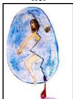
Рис.6. Драматична подія мого життя