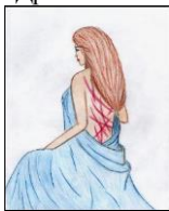
Рис.3. Моє минуле