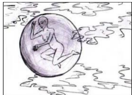
Рис.7. Відчуття самотності

Представлені малюнки студентів-учасників глибинного пізнання психіки (АСПП) ілюструють тенденцію нанесення фізичних пошкоджень власній персоні (див. рис. 1-4). Ілюстрації дозволяють діагностувати особливості проявів мазохізму та деструктивних тенденцій у поведінковому аспекті, які він задає. Аналізуючи малюнки можна спостерігати прояви аутоагресивних (агресії повернутої на самого себе) тенденцій, які пов'язані з внутрішніми протиріччями («люблю – не люблю», «хочу бути коханим – хочу дистанціюватися, бути самотнім»). Неможливість адекватного вираження чуттєвої сфери призводить до активізації енергії мортідо, яку