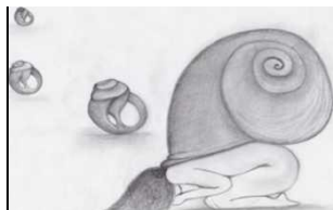
Рис.5. Проблеми, з якими важко впоратися