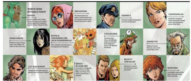
Рис. 2. Інтродукція персонажів у графічних наратива циклу "Fables" (Bill Willingham)

ім'я і стислу дескрипцію його функції у наративі (див. рис. 2).