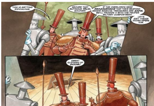
Рис. 4. Наративний епізод серії “A Revolution in Oz” циклу графічних наративів “Fables” [24, p. 15]

Творення точки зору фокалізатора. Ефект присутності. Графічні наративи сконструйовані із низки епізодів, маніфестованих у спеціальних пенелях через вербальний та візуальний семіотичний код. Кожна така панель постає статичним кадром, що має певний план зображення: дальній, загальний, середній, крупний [1, с. 289]. Маніпулювання планом зображення кадру створює динамічність або сповільнення руху подій, наративну графічну салієнтність та є засобом творення ефекту присутності. Продемонструємо наративні засоби кадрово-графічного конструювання наративу на прикладах епізодів серії “A Revolution in Oz” циклу графічних наративів “Fables” (див. рис. 4).