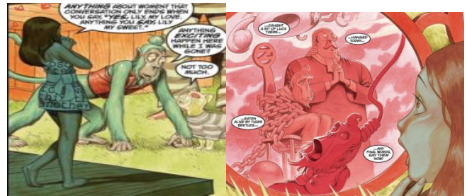
Рис. 5. Графічні наративні прийоми творення точки зору фокалізатора та ефекту присутності [24, p. 19]

У казкових графічних наративах серії “A Revolution in Oz” циклу графічних наративів “Fables” фокалізатором подій постає персонаж Лілі, яка вирізняється від інших маленьких зростом. Творення точки зору фокалізатора відбувається завдяки візуальному зображенню персонажів великого зросту і фокусу камери з нижньої точки, що ніби відтворює епізод знизу вгору, очима маленької Лілі, для якої все навкруги значно більше за неї (рис. 5.). Лілі бачить все наївно через рожеві окуляри, у наступному кадрі кут, під яким маніфестовано наративний епізод у кадрі, створює ефект присутності читача, який разом із Лілі зазирає у рожеві окуляри і бачить події саме так як вона.