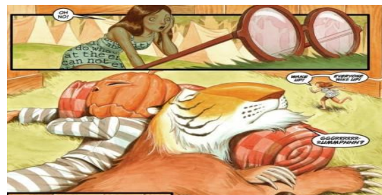
Рис. 3. Наративний епізод із серії "A revolution in Oz" [24, р. 21]

Інтервізуальність. Семіотична перекодифікація. У наведених нижче експозиційних нарративних епізодах (див. рис. 3.) наявні головні та епізодичні персонажі казки Баума, яких читач-дитина може легко упізнати за їх зовнішністю: Jack Pumpkinhead (персонаж із тиквою замість голови), літаюча мавпа Буфкін, Боягузливий Лев (Cowardly Lion). Дороті, що у казці за віком є дитиною, у графічному наративі "Fables" постає підлітком, а її пишна сукня трансформується на сучасне повсякденне вбрання. Замість дівчинки Дороті у наративі Лілі, чий юний вік втілено у її маленькому на зріст персонажі. Лілі – зменшена дівчинка.