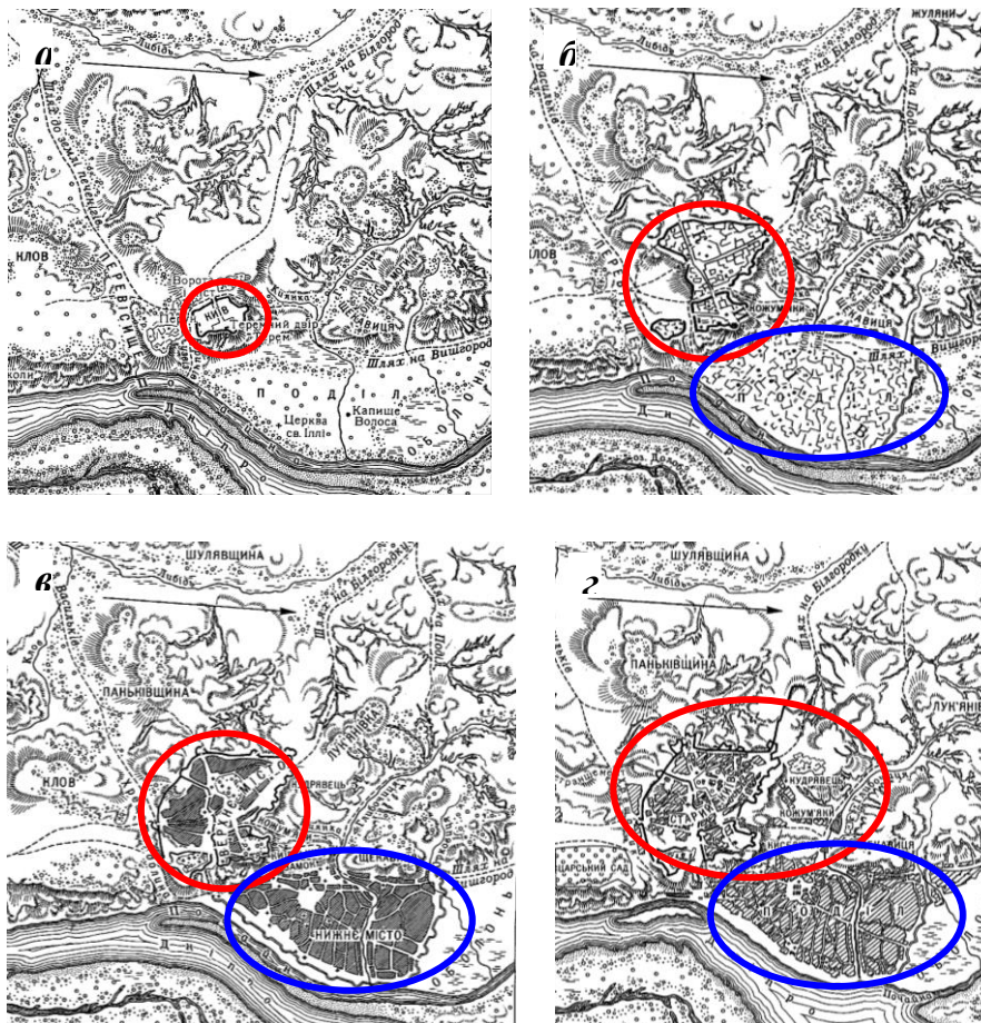
Рис. 2. Планування історичного центру Києва з X до початку XIX століть на основі первинного Вишгорода (фрагменти мап за М.В.Закревським [17]): а – місто Володимира, X століття; б – поява міста Ярослава та території Михайлівського монастиря, а також Подолу як поселення з непорядкованою забудовою, 988-1240 роки; в – формування поселень навколо міста Ярослава, на Подолі утворилася система ремісничих та торговельних вулиць, 1400-1600 роки; з – подальше розширення київської території, 1700-1800 роки (червоним кольором позначений Вишгород, синім – Поділ)

Розвиток міської території та зміна моделі його структури з плином часу стимулювалися тенденцією зросту кількості потрібних суспільству нових функцій побутово-виробничого характеру, їх ускладненням, інтеграцією у міський простір, що створило систему зонування території міста, а потім і регіонального планування, й навіть системи населених місць державного і міждержавного рівнів економічних зв'язків. Йдеться про перший тип комунікацій як функціонального зв'язку. Другий тип комунікацій – як візуально-інформаційний зв'язок, що надає можливість оцінювати середовище з естетичної точки зору, сформувався за доби утворення держави з вже вираженою економічною системою, в зв'язку із єдністю станів суспільно-економічного, політичного та культурного розвитку, характерного для всіх сфер людської діяльності на певному етапі. Культурна діяльність передбачає і напрямки організації простору перебування людини, в першу чергу міського, що концентрує різні сфери культурної діяльності, в тому числі й архітектурно-містобудівну.