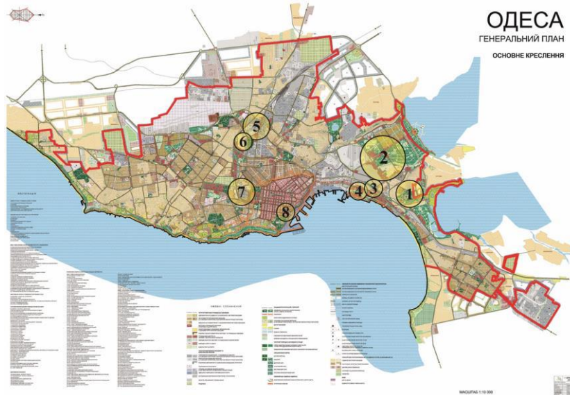
Рис. 3. Новий Генеральний план Одеси

онального ділового та туристичного центру; в структурі виробничого комплексу в найближчі 15-20 років має скоротитися частка хімічної та нафтохімічної промисловості, металургії та металообробки, при цьому зросте частка виробництва будматеріалів – все це забезпечує перспективний розвиток рекреації; існуючі зелені насадження, які займають понад 740 га, будуть збережені, крім того, з'являться нові озеленені площі понад 900 га – наприклад, парк «Ювілейний» на приморських схилах, парки «Хаджибейський», «Аеропортовський» і гідропарк «Куяльницький» [10].