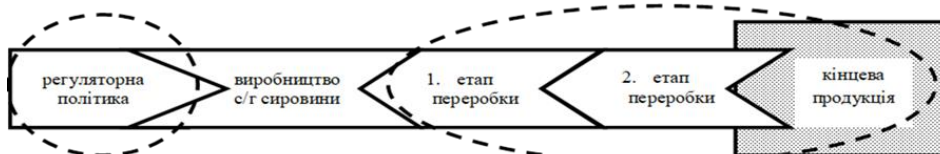
Рис. 2. Агропродовольчий ланцюг, орієнтований на попит

З урахуванням того, що ми використовуємо підхід, орієнтований на попит, який передбачає споживача як вирішальний фактор структурних перетворень та розвитку світового сільського господарства та ринків сільськогосподарської продукції, відносини стають більш надійними (рис. 2).