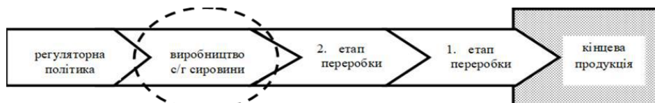
Рис. 1. Агропродовольчий ланцюг, орієнтований на постачання

Економічне значення процесу обробки та доопрацювання (тобто харчова промисловість та розподіл продуктів) з часом збільшилося. Питома вага споживчих витрат на продукти харчування, які приймаються переробниками та дистриб'юторами, відображає внесок цих секторів в продовольчий потік до споживачів. Переробники та роздрібні торговці продуктами харчування рекламують свої товари, щоб максимізувати свою частку в споживачьких витратах на продукти харчування [5].