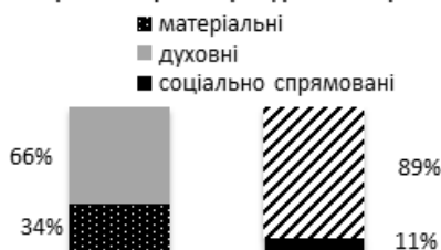
Мал. 1. Ціннісні орієнтації підлітків – правопорушників

На основі цієї градації ми виявили типи дітей у яких ціннісні орієнтації звелися до двох показників і усі досліджувані були розподілені на 4 групи , а саме: