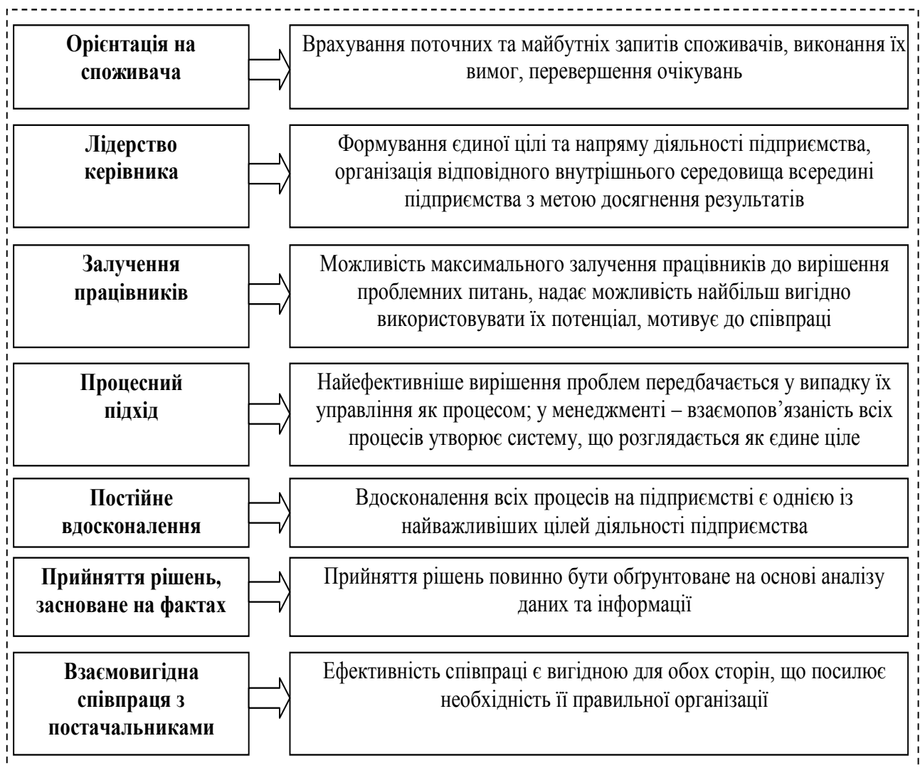
Рис. 2. Принципи менеджменту на основі якості в теорії TQM [4]

Як зазначає М.В. Плотніков [6], TQM є адаптацією класичного операційного менеджменту до мінливого зовнішнього середовища, коли норми виробництва як метод управління стають неефективні. Концепція орієнтована на якість – матеріалів, процесів, продукції, доставки та обслуговування.