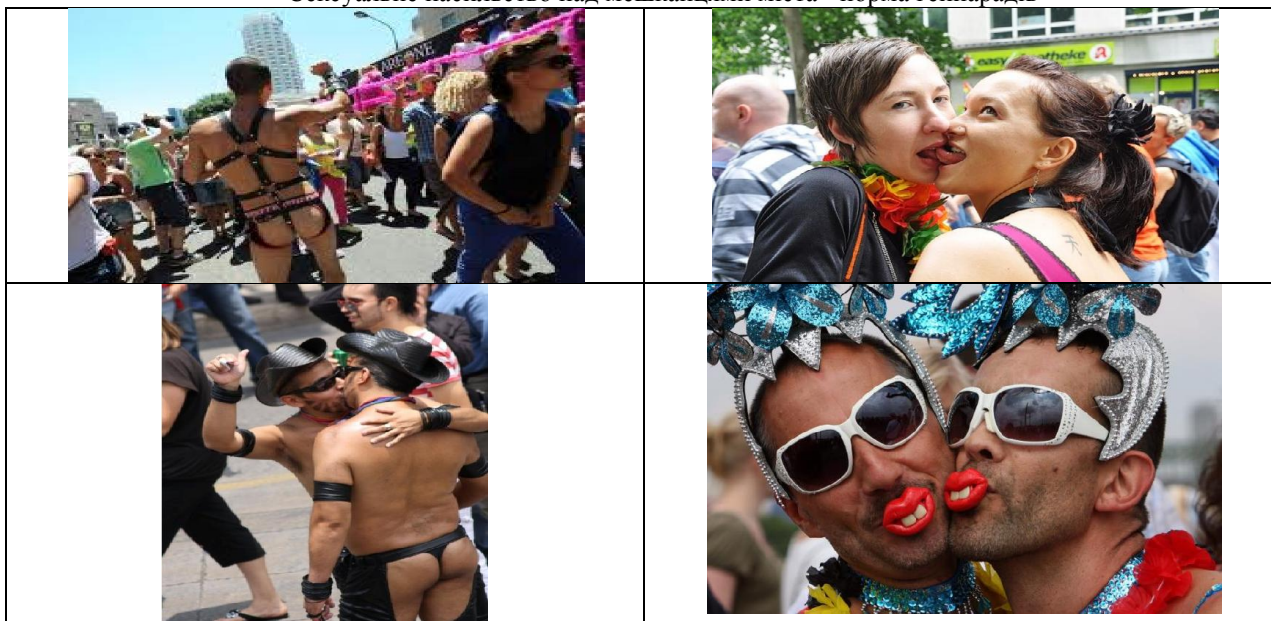
Сексуальне насильство над мешканцями міста - норма гейпарадів