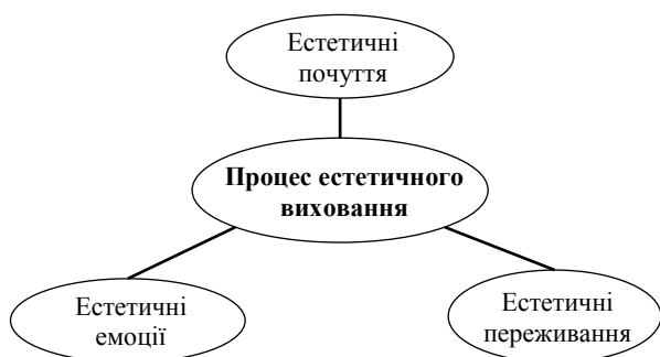
Рис. 1. Складові процесу естетичного виховання

Відмітимо, на переконання методиста естетичне формування особистості має бути цілеспрямованим, організованим, взаємозалежним, тобто поєднуватись в єдину систему естетичного виховання. До даної системи Н. Волошина відносила вагомі емоційно-чуттєві складові даного процесу [5, с. 6] (подаємо їх схема-тично на рис. 1).