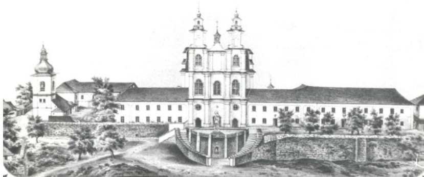
Рис. 2. Монастир отців Василіанів у Бучачі.

тривають до сьогодні реставраційно-будівельні роботи. У приміщенні гімназії сьогодні працює колеґіум імені св. Йосафата, яким опікуються отці Василіяни.