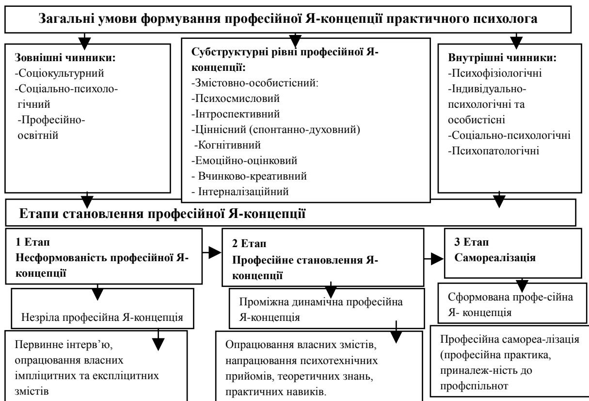
Рис. 2 Теоретична модель формування професійної Я-концепції практичного психолога

терапевта (рис.1). В подальшому запропонована нами освітня модель ґрунтується на поділі практичної психологічної освіти на первинно практичну, яка включає психотерапевтичне опрацювання власного життєвого досвіду, та вторинну теоретичну, що містить засвоєння спеціально-психологічної теорії з опорою на здобуту рефлексій особистих переживань. Опрацювання та теоретична рефлексія повинна стосуватися змістів Я-концепції на всій онтогенетичній осі та в 4-х модальностях: когнітивній, емоційно-оцінковій, ціннісно-духовній та поведінковій (вчинкові-креативній). Насамперед, мова йде про психокорекційно-психотерапевтичне опрацювання психологом власних особистісних дефіцитів (дефіцитарні прояви Я-концепції, зумовлені інтерналізацією негативного досвіду стосунків і суб'єктивним конструюванням їх травматичного значення, які свого часу деформували особистісний розвиток шляхом патопсихологічних гіперкомпенсацій) [3; 8; 16; 18].