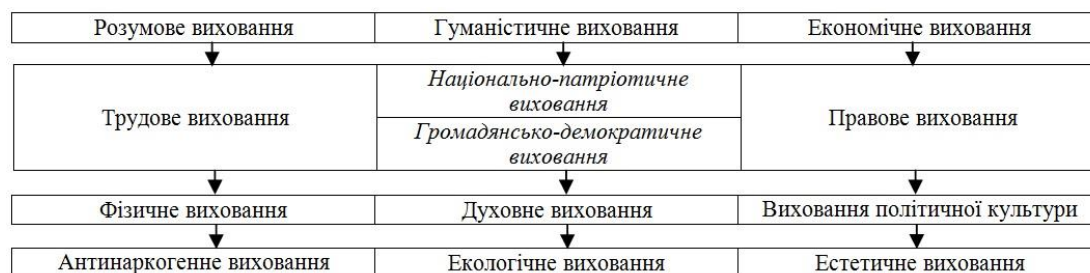
Рис. 1. Ключові напрямки змісту виховного процесу у ВНЗ

Виходячи з вже зазначеного, на сучасному етапі розвитку українського суспільства доцільно виокремити такі ключові напрямки змісту виховного процесу (див. рис. 1)