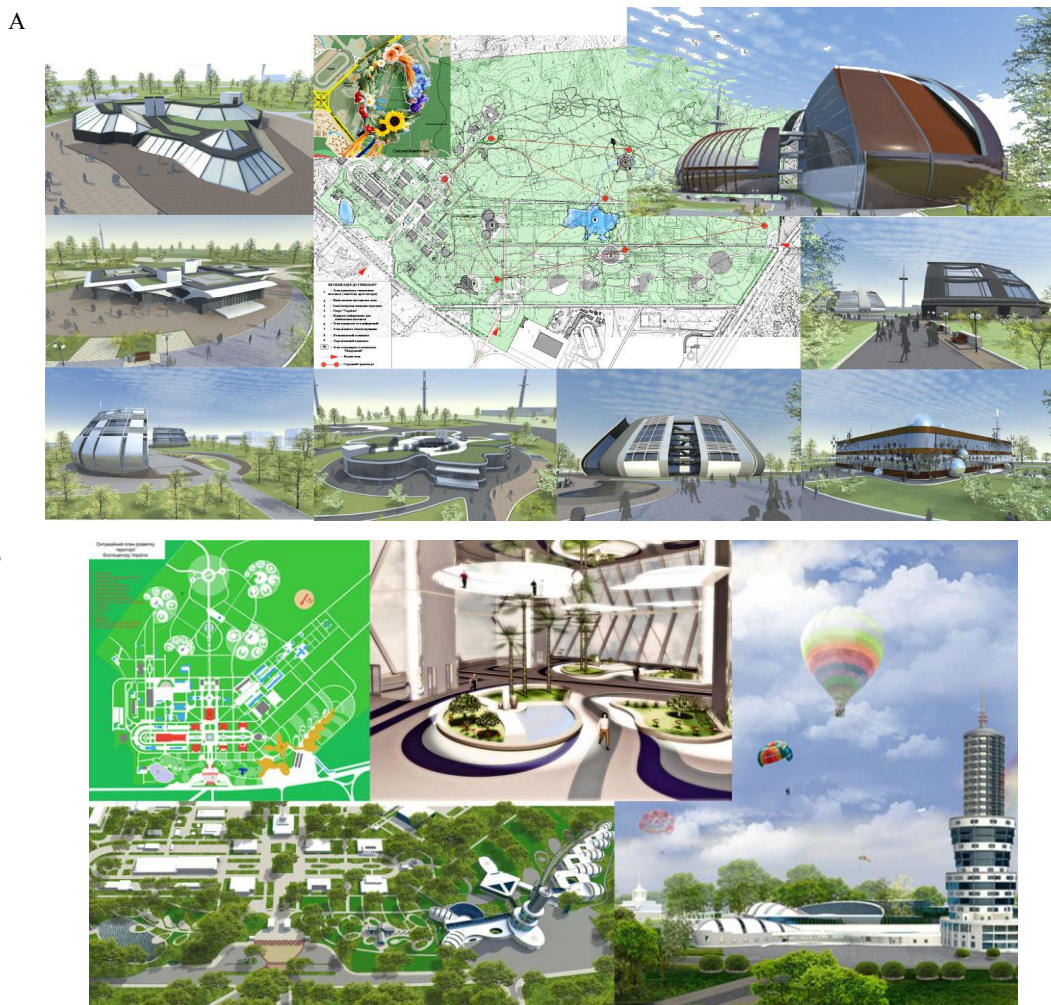
Рис. 3. Фрагменти з дипломних проектів, кафедра Основ архітектури і архітектурного проектування, Київський національний університет будівництва і архітектури (керівник: кандидат архітектури, доцент – Тетяна Ладан):

мування, вивчення технічних та природничих наук). Наближаючи майбутнє, використовуючи в проекті запропоноване використання сучасних видів транспорту – монорейкового [7].