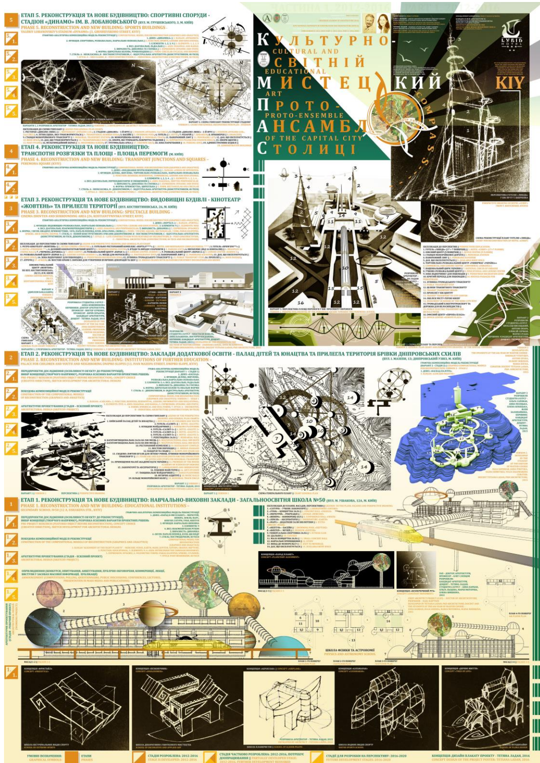
Рис. 2. Рекламний плакат проекту «Компас» (концепція дизайн-плакату проекту: архітектор – Тетяна Ладан, 2016 р.)

(стадія – ескізний проект); 4. Оприлюднення; 5. Архітектурне проектування (стадія – робочий проект).