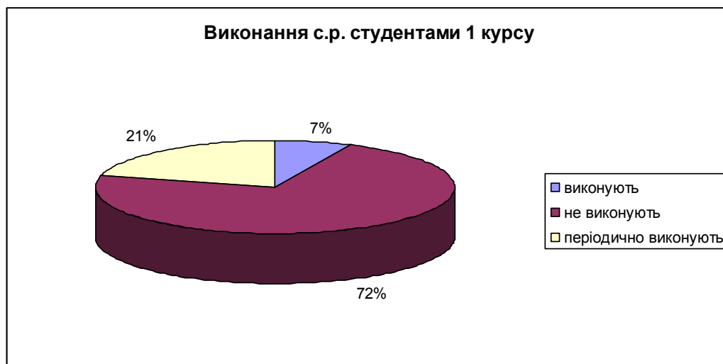
Діаграма 2. Виконання самостійної роботи студентами

Але, на жаль, у практичній діяльності не всі умови забезпечуються, студенти часто не готові до організації самостійної роботи, стикаються з багатьма труднощами під час виконання самостійної роботи, і результатом цього є її невиконання. Це можна стверджувати після обробки результатів анкетування студентів 1 курсу Горлівського інституту іноземних мов ДВНЗ «Донбаський державний педагогічний університет». 72% опитаних вважають самостійну роботу недоцільною (зважаючи на велику кількість, на думку студентів 1 курсу, аудиторних годин, що дозволяють оволодіти навчальним матеріалом на високому рівні), 21% студентів виконує завдання для самостійного опрацювання періодично (причиною цього вони називають перевантаженість з багатьох предметів), 7% студентів завжди виконують завдання для самостійної роботи. Результати анкетування проілюстровані діаграмою 2.