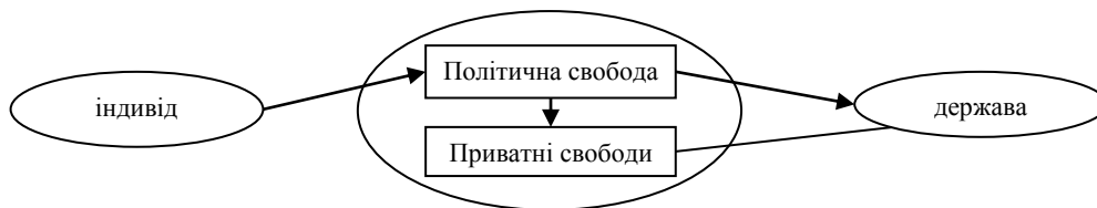
Рис. 2. Б. Констан: модель відносин людина – держава

На рис. 2 зображено модель відносин людина – держава у концепції Б. Констана. На думку Б. Констана, індивід у тогочасній державі знаходить нові форми спілкування з іншими людьми, а тому йому необхідна свобода приватної сфери. Однак, саме цю свободу індивіди не можуть самі собі гарантувати, це може зробити лише держава.