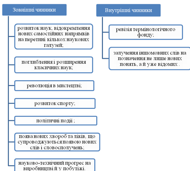
Схема 2. Основні чинники виникнення термінології

дання термінологічного стандарту (Схема 3). Визначити основні способи творення термінів (Схема 4).